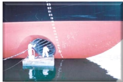
Обработка днища судов