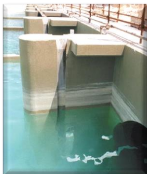
Обработка причалов ELASTUFF