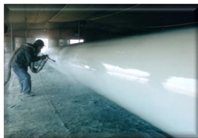
Нанесение ELASTUFF на трубопровод