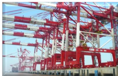
ELASTUFF – обработка портов